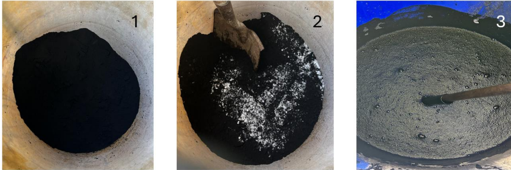
Fotografías 1 a 3. Etapas del proceso de preparación del extracto de leonardita (1) leonardita en polvo, (2) mezcla con hidróxido de potasio y (3) extracto final.